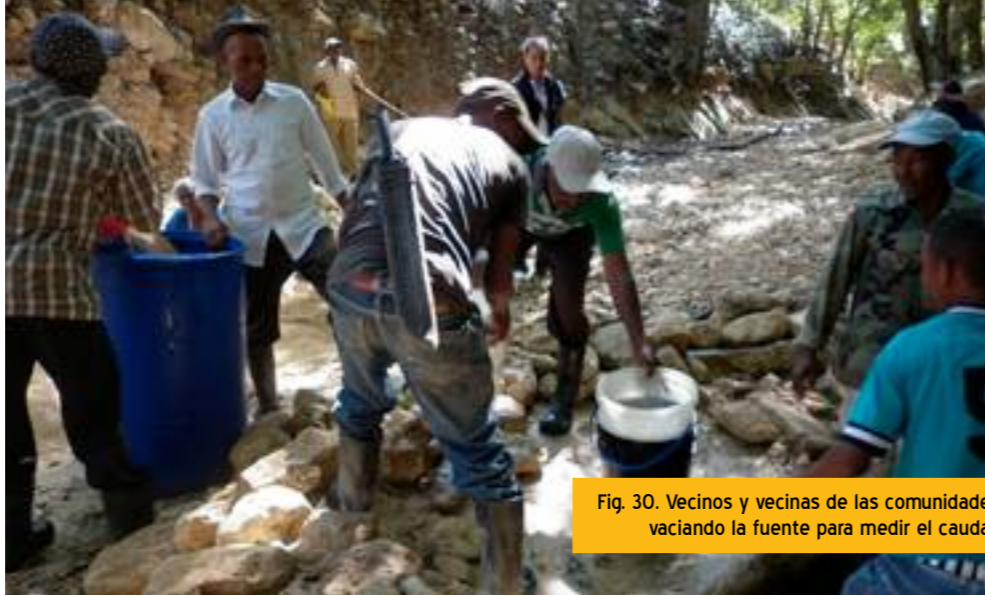
Fig. 30. Vecinos y vecinas de las comunidades vaciando la fuente para medir el caudal.

Una vez elegida el agua como la alternativa del proyecto a realizar, se propusieron posibles soluciones técnicas. En terreno se barajaron distintas opciones con las comunidades y en sede se analizaron éstas de una manera más detallada, adaptándolas al presupuesto potencialmente disponible.