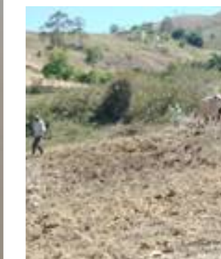
Fig. 6 y 6.1. Vistas de una de las comunidades.