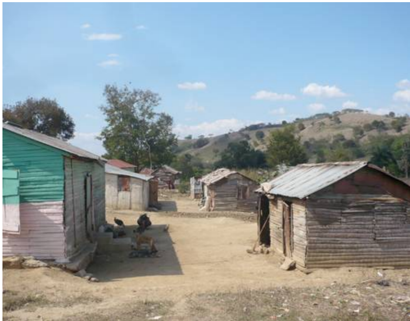
Casas de la Comunidad de Sabaneta