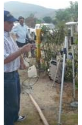
Fig. 27. Compañeros del INDRHI e INAPA realizando mediciones de altimetría y localización.

Finalizado el trabajo sobre el árbol de objetivos, se dispuso a la elección de la alternativa que daría comienzo la intervención conjunta en la zona. Las comunidades se pronunciaron unánimemente sobre su prioridad, la cual sería la relacionada con la salud y el acceso al agua. Teniendo en cuenta esto, y el hecho de que se considera prioritaria la cobertura de las necesidades básicas y los DDHH de la población, se decidió retener la intervención en salud y el acceso al agua como primera acción de las futuras intervenciones posibles en la zona.