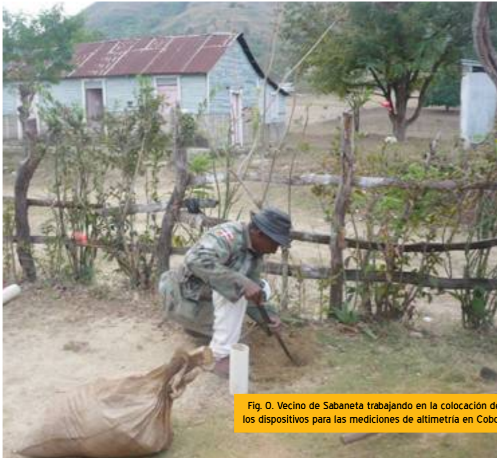
Fig. 0. Vecino de Sabaneta trabajando en la colocación de los dispositivos para las mediciones de altimetría en Cobo.

Dada la importancia de la identificación, que podría marcar el éxito o fracaso del proyecto, es necesario que las personas que identifiquen tengan experiencia previa y que estén acompañadas por personas locales con experiencia. Generalmente las identificaciones se suelen hacer con un equipo mixto de personas de la ONGD del país donante y un equipo local de la contraparte o población destinataria.