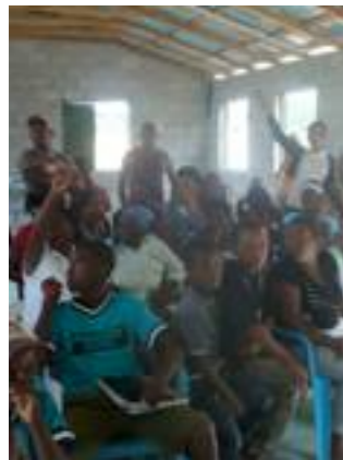
Fig. 22. Debate sobre los problemas en las cuatro comunidades.