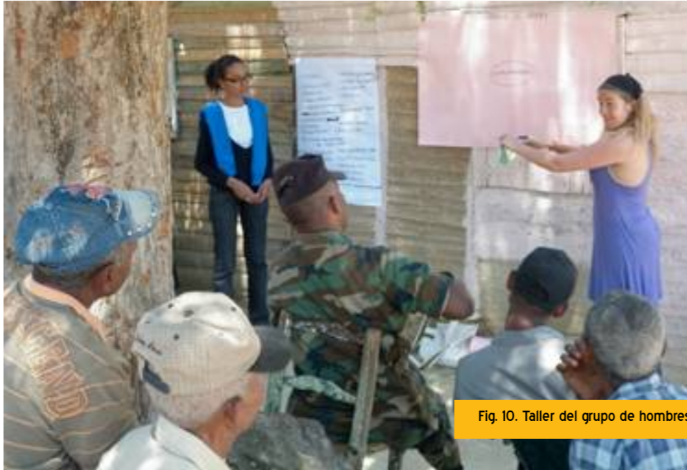
Fig. 10. Taller del grupo de hombres

Con este taller se intentaron identificar los agentes involucrados, su importancia en el marco del proyecto para las comunidades y el tipo de relación existente -la frecuencia y la direccionalidad (unidireccional o bidireccional)-, así como los posibles obstáculos y relaciones a fortalecer. Tras este, se obtuvieron algunos datos sorprendentes pues emergieron asociaciones, instituciones...de las que no se tenía constancia.