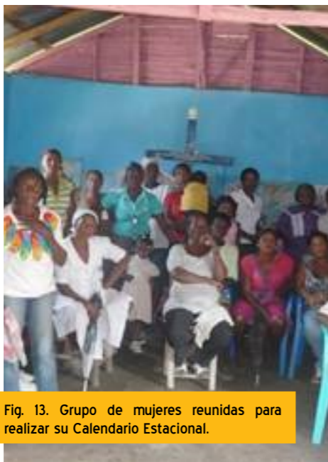
Fig. 13. Grupo de mujeres reunidas para realizar su Calendario Estacional.