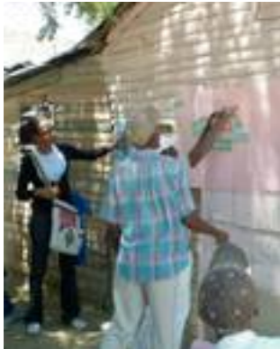
Fig. 11. Colocando cartulinas en el Diagrama de Venn.