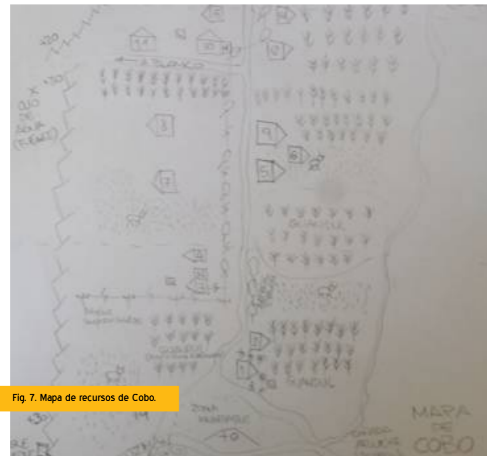
Fig. 7. Mapa de recursos de Cobo.