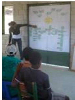
Fig. 23. Convirtiendo el "Árbol de Problemas" en "Árbol de Objetivos".

El análisis de las prioridades de desarrollo de los agentes interesados ayuda a planificar el desarrollo basado en las prioridades y necesidades de las mujeres y de los hombres de la comunidad. Con este fin se utilizaron las siguientes herramientas: