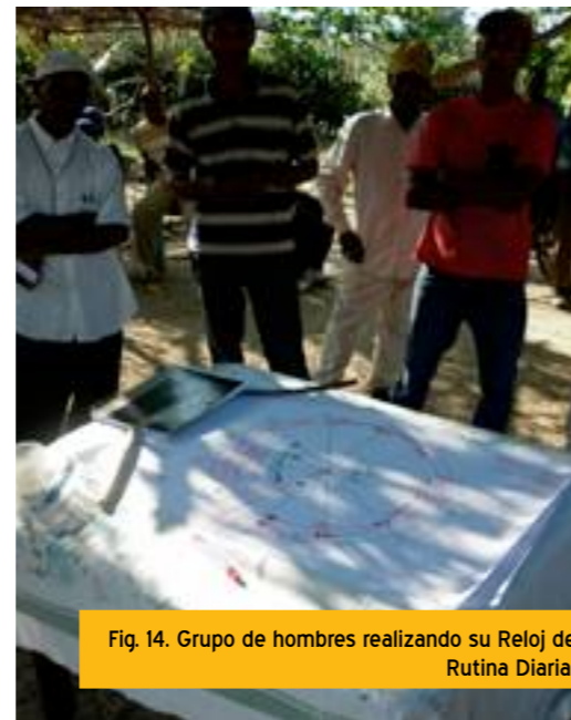
Fig. 14. Grupo de hombres realizando su Reloj de Rutina Diaria.

Utilización y control de recursos (Ver Anexo V) Las tarjetas con ilustraciones de recursos de la zona ayudaron a analizar el uso y el control de los recursos por parte de los hombres, las mujeres y la pareja dentro del hogar, y en otros ámbitos de la comunidad. Se pretendía comprender la gestión de los recursos y la participación en la toma de decisiones tanto en el hogar como en la comunidad por parte de las mujeres y los hombres.