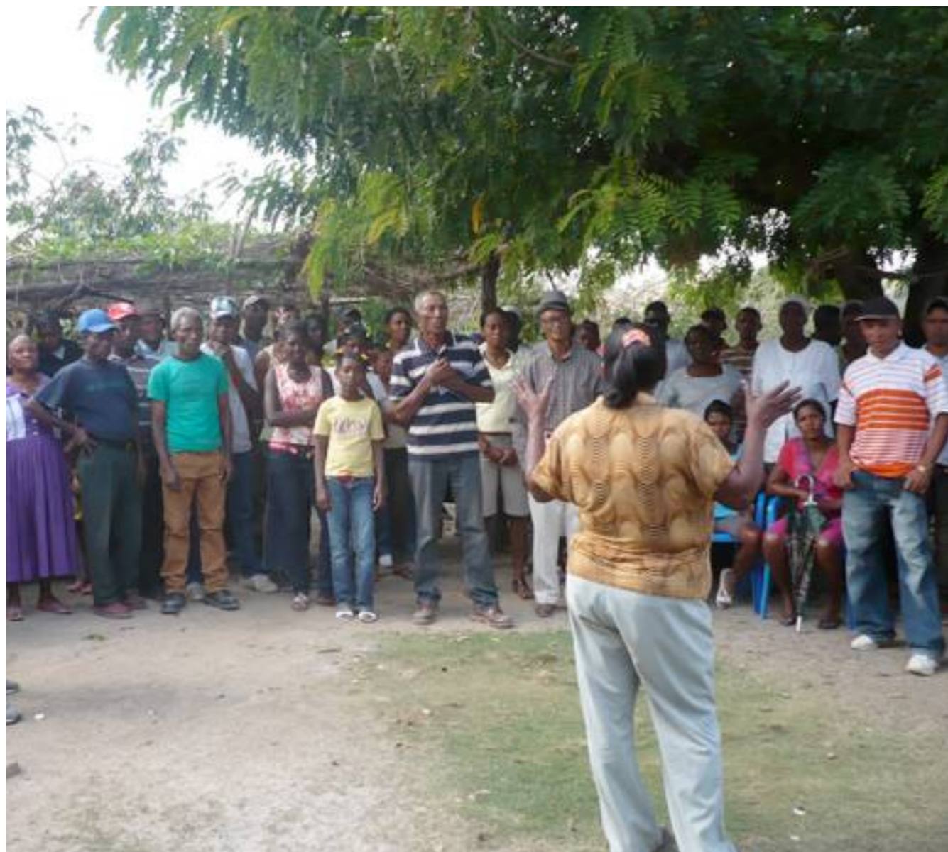
Reunión de la Comunidad.

Agradecer la colaboración y el trabajo tan activo de las comunidades, las mujeres CONAMUCA así como del voluntariado de ISF.