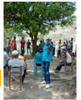
Fig. 18. Reunión de las cuatro comunidades.

Factores influyentes (Ver Anexo VII) Sirvió para organizar la información obtenida a partir de un detallado análisis sobre el diferente impacto de género de algunos factores estructurales, tales como el sistema político, las condiciones financieras y económicas y afiliación étnica, las tradiciones culturales, las normas sociales, la religión, el sistema educativo, las condiciones ambientales, la estructura demográfica, las leyes y regulaciones existentes, u otros.