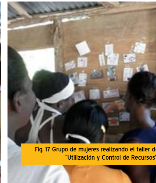
Fig. 17 Grupo de mujeres realizando el taller de "Utilización y Control de Recursos".