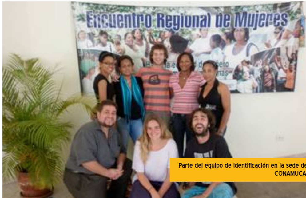
Parte del equipo de identificación en la sede de CONAMUCA.

El grupo de identificación en terreno realizaba informes semanales plasmando toda la información o documentación que se iba generando. Estos informes eran enviados tanto a la sede de ISF como a la de CONAMUCA cada semana. De esta manera se trabajaba conjuntamente con las personas en ambas sedes, completando y enriqueciendo todo el proceso.