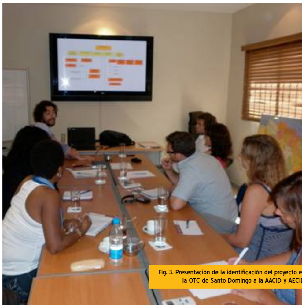
Fig. 3. Presentación de la identificación del proyecto en la OTC de Santo Domingo a la AACID y AECID.

SEMANA 5: Recopilación de documentación importante y presentación de la identificación realizada ante la AECID y la AACID.