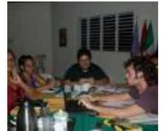
Fig.1 y Fig. 2. Reunión en terreno para identificación.