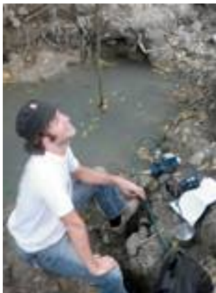
Fig. 33. Toma de agua para analizar.