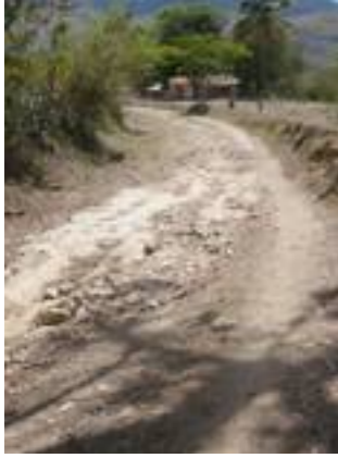
Fig. 31. Camino de acceso a las comunidades