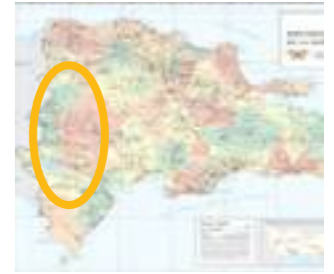
Se muestra en el mapa seleccionado el área de actuación.

Nuestra Organización ha decidido tomar serio compromiso con las actuaciones coordinadas con otras acciones de cooperación allá donde intervenga (principio de complementariedad), y por ello, tomó como referencia otras intervenciones en la zona priorizada para llevar a cabo esta identificación. Debido a los contactos institucionales realizados en la fase previa a la identificación en terreno se conocía el trabajo en agua y saneamiento que se está realizando en la provincia de Elías Piña entre el Banco Interamericano de Desarrollo (BID), la AECID e INAPA financiados por el Fondo de Cooperación para el Agua y Saneamiento (FCAS). Y también se conocía el trabajo que está realizando la AACID en Elías piña en los sectores de agua, saneamiento y salud. Permitiría a su vez interactuar mejor con la población de origen haitiano ya que, ésta se encuentra integrada en la sociedad de la provincia de Elías Piña.