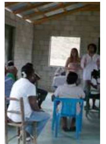
Fig. 20. Grupo de mujeres trabajando en el taller de "Necesidades prácticas e intereses estratégicos"