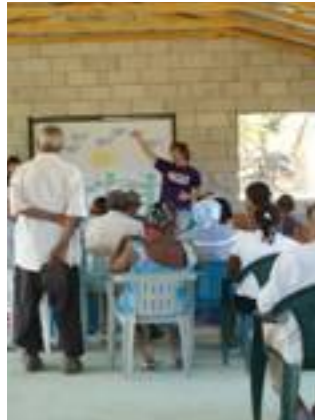
Fig. 21. Elaboración del "Árbol de Problemas".