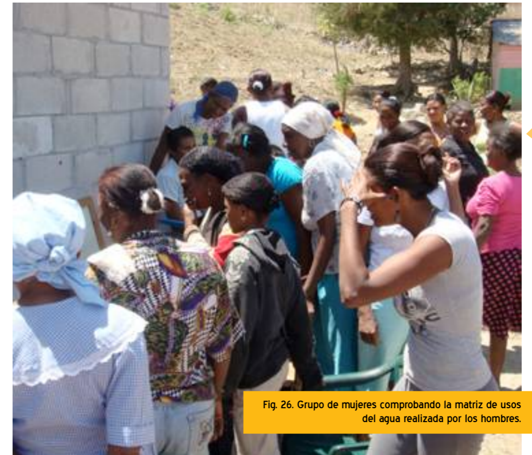
Fig. 26. Grupo de mujeres comprobando la matriz de usos del agua realizada por los hombres.

Esta herramienta ayudó a analizar la situación de las cuatro comunidades respecto a las diversas fuentes de agua existentes en la zona y a los diferentes usos del recurso