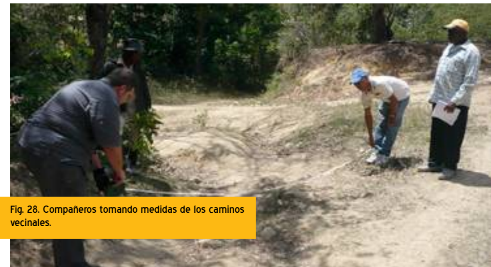
Fig. 28. Compañeros tomando medidas de los caminos vecinales.