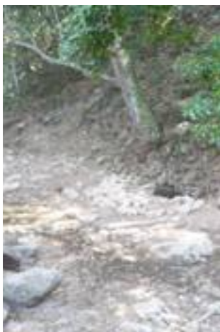
Fig. B. Camino de acceso a Matadero.

En terreno, para esta actividad, se dividió el equipo en cuatro grupos para cubrir simultáneamente las cuatro comunidades, acompañados de personal local en todo momento.