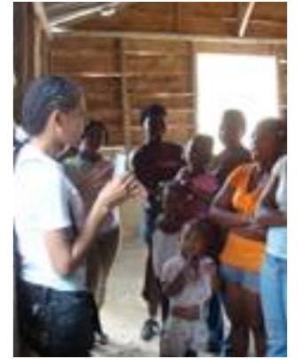
Fig. 15. Compañera de CONAMUCA y mujeres de las cuatro comunidades en el taller de "Utilización y Control de Recursos".