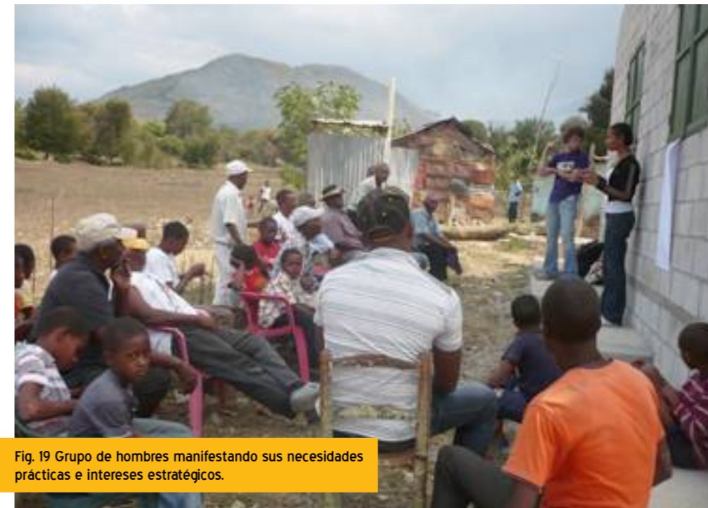
Fig. 19 Grupo de hombres manifestando sus necesidades prácticas e intereses estratégicos.

Factores influyentes (Ver Anexo VII) Sirvió para organizar la información obtenida a partir de un detallado análisis sobre el diferente impacto de género de algunos factores estructurales, tales como el sistema político, las condiciones financieras y económicas y afiliación étnica, las tradiciones culturales, las normas sociales, la religión, el sistema educativo, las condiciones ambientales, la estructura demográfica, las leyes y regulaciones existentes, u otros.