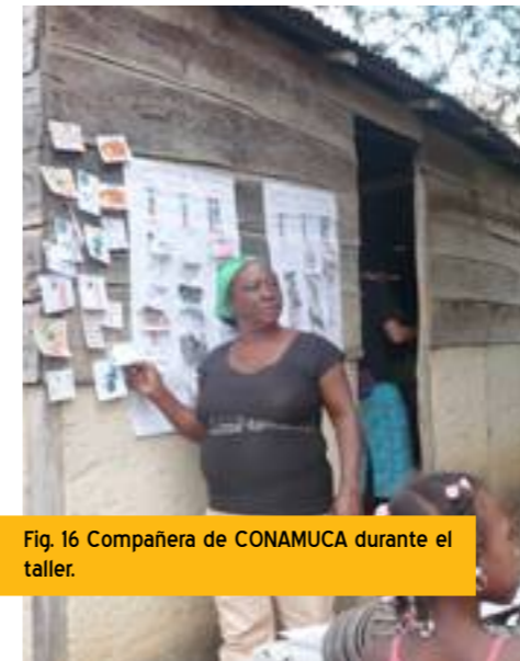
Fig. 16 Compañera de CONAMUCA durante el taller.