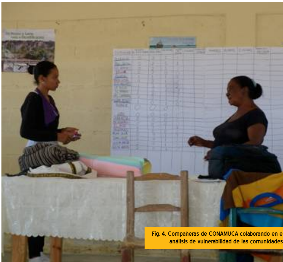
Fig. 4. Compañeras de CONAMUCA colaborando en el análisis de vulnerabilidad de las comunidades.

Una vez recabada toda la información se comenzó a trabajar en estas cuatro comunidades rurales pertenecientes al distrito municipal de Guanito, municipio de El Llano, provincia de Elías Piña, República Dominicana.