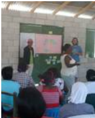
Fig. 8 y 9. Grupo de mujeres realizando el Diagrama de Venn.