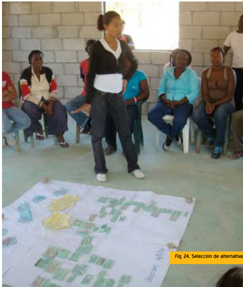
Fig. 24. Selección de alternativas.

Análisis que consistió en la selección de la/s estrategia/s que se aplicaría/n para alcanzar los objetivos deseados. Se determinó que área o áreas del "árbol de objetivos" se convertirían en el proyecto a ejecutar y los objetivos que deberían formar parte de otros proyectos.