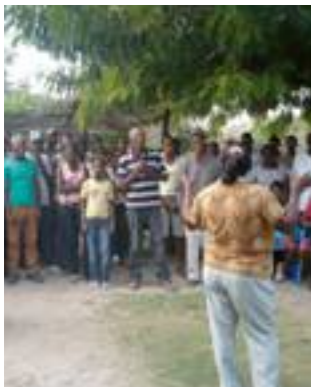
Fig. 12. Presentación del taller en el que se trabajaría el Calendario Estacional y el Reloj de Rutina Diaria.

Con este taller se intentaron identificar los agentes involucrados, su importancia en el marco del proyecto para las comunidades y el tipo de relación existente -la frecuencia y la direccionalidad (unidireccional o bidireccional)-, así como los posibles obstáculos y relaciones a fortalecer. Tras este, se obtuvieron algunos datos sorprendentes pues emergieron asociaciones, instituciones...de las que no se tenía constancia.