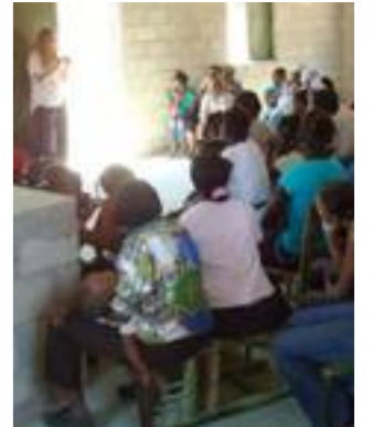
Fig. 25. Matriz de usos del agua con el grupo de mujeres.

El análisis de las fuentes con mediciones grosso modo de las distancias a cubrir y caudales con posibilidad de suministrar durante la identificación es necesaria para estudiar la viabilidad técnica y económica del proyecto, con los datos obtenidos se realiza un prediseño de las instalaciones y de las actividades.