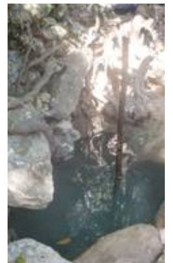
Fig. 29. Medición del caudal de la Noria de Amelia.