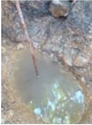
Fig. 32. Medición del caudal de agua de la fuente.