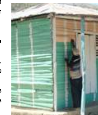
Fig. 5. Vecino de la comunidad marcando la casa para la elaboración del censo.