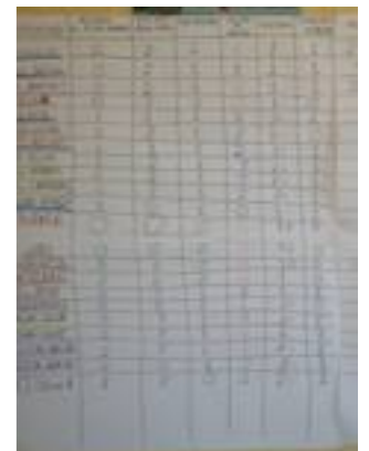
Fig. A. Tabla de priorización.

Una vez tomada la decisión de que fuese el municipio de El Llano dónde se trabajaría, había que concretar en qué comunidades se iba a llevar a cabo la identificación, debido a que en este municipio había muchas comunidades con distintas necesidades. Para ello se convocó una reunión en el Centro Comunal de Palo Seco (una de las comunidades pertenecientes a El Llano), con representantes de la Federación de Mujeres Campesinas de El Llano. La reunión tenía un doble objetivo, por un lado presentar al equipo de identificación y por otro lado, obtener información sobre la situación de las comunidades del municipio. La dinámica llevada a cabo consistía en completar una tabla de Priorización-Vulnerabilidad de las comunidades y así obtener los datos más relevantes. Se dio un proceso participativo abierto en el que todas las mujeres presentes aportaron la información necesaria. La tabla consistía en enumerar a todas las comunidades, pues no existían datos oficiales que plasmaran la realidad e ir analizando una a una si contaban con una serie de servicios básicos tales como agua, educación, electricidad, centro sanitario... así como el porcentaje aproximado tanto de mujeres como de población haitiana (ver Anexo I).